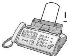
Na ilustracji przedstawiono model KX-FP207.